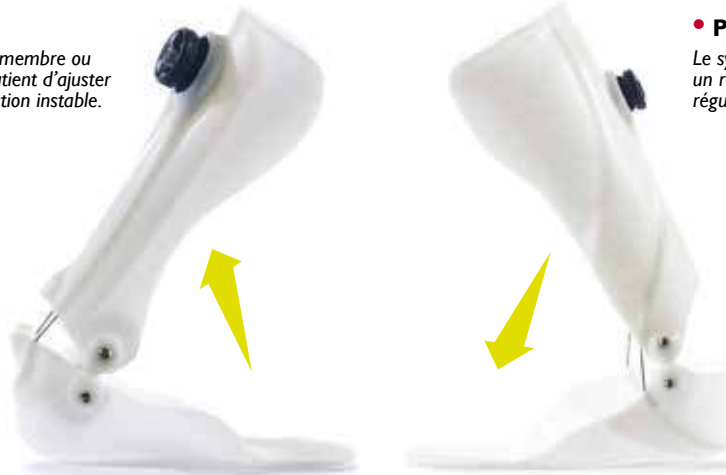
Montage flexion dorsale

La mobilité peut être améliorée de façon sécurisée en augmentant progressivement les niveaux de tension.