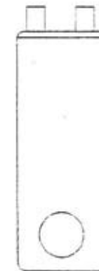
CLE DE DEMONTAGE du bouton poussoir