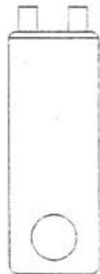
CLE DE DEMONTAGE du bouton poussoir